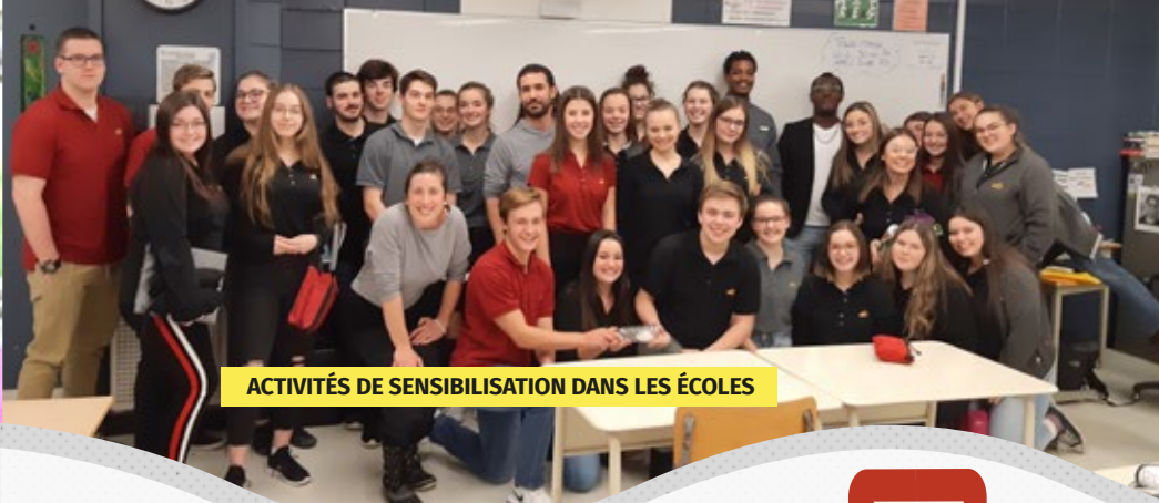
ACTIVITÉS DE SENSIBILISATION DANS LES ÉCOLES