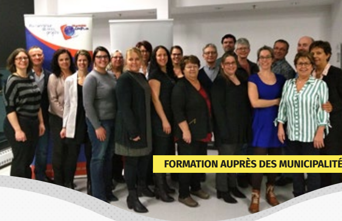
FORMATION AUPRÈS DES MUNICIPALITÉS